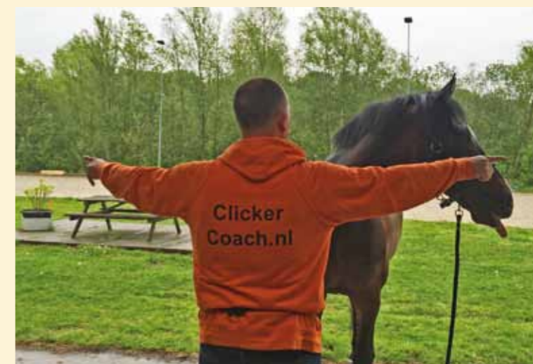
Onder: Onduidelijke cue