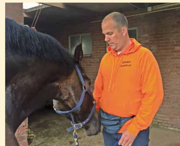
Boven: Onbeleefd in mijn ruimte zelf voer pakken