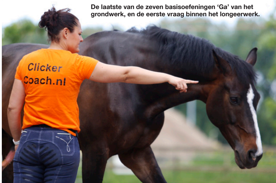
De laatste van de zeven basisoefeningen 'Ga' van het grondwerk, en de eerste vraag binnen het longeerwerk.

We horen regelmatig van mensen dat trainingsplannen voor hen niet werken, of dat zij niet met trainingsplannen werken. Laat ik je een geheim vertellen: iedereen werkt met een trainingsplan. Als je namelijk je paard iets wilt aan- of afleren, dan denk je daar over na. Dan bedenk je stappen om te bereiken en heb je